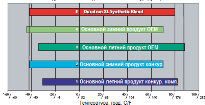
Диапазон рабочих температур для Duratran XL Synthetic Blend по сравнению с летней и зимней гидравлическими жидкостями OEM и конкурирующей компании

Для круглогодичного использования при предельных температурах мы рекомендуем применять DURATRAN® SYNTHETIC, который эффективно защищает как при низких, так и при высоких температурах. DURATRAN® SYNTHETIC отвечает требованиям как спецификации John Deere JDM J20D (летние марки вязкости), так и JDM J20D (зимние), а также рекомендаций всех основных производителей оригинального оборудования OEM. Данные о продукте DURATRAN® SYNTHETIC содержатся в паспорте этого смазочного материала (документ № IM 7981).